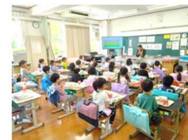
▲1年生への給食指導