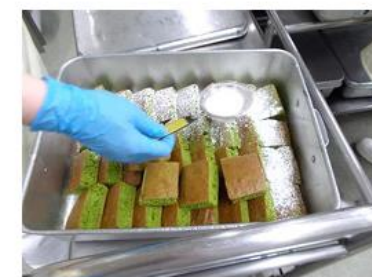
▲児童に大好評、緑が鮮やかな足立区の小松菜を使ったケーキ