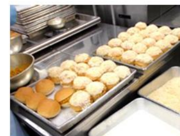
▲特製フィリングをたっぷり挟み、オーブンで焼くカレーパン