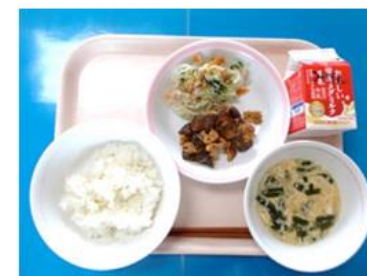
▲レバーの味付けに工夫を施したレバーのみそオイスターがらめ