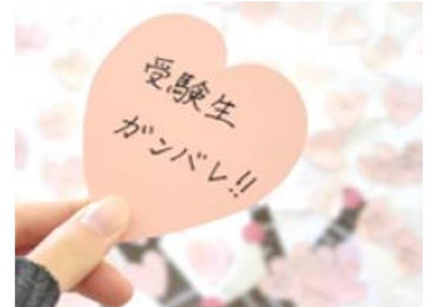
▲メッセージカードに書かれた受験生の応援メッセージ

メッセージの記入はどなたでも大歓迎。受験生の方はお互いの応援や受験への意気込み、受験を経験した方は受験の思い出やアドバイス、励ましの言葉など、様々なメッセージをお待ちしております。メッセージカードは、桜の木の傍に設置予定です。