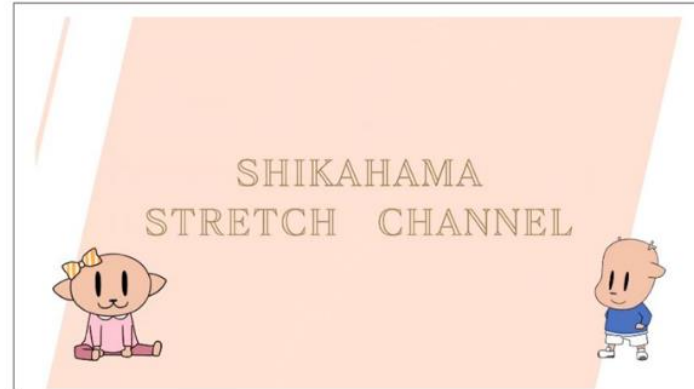
▲YouTube で公開されている動画

ケガ予防、心身の健康増進などの効果があり、トレーニングルームの利用者でない方にもおススメです。ぜひご覧ください。