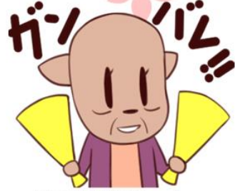
▲鹿浜地域学習センター キャラクター しか代

今回は、毎年12月と1月に開催している中学3年生向けの模擬面接会「高校受験生応援団」と、それに合わせ、鹿浜センターで実施している受験生へのサポートの取り組みを紹介します。