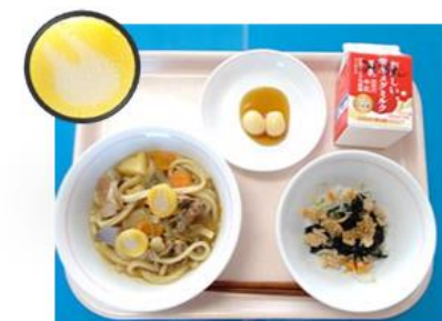
▲お月見給食のけんちんうどん うさぎがモチーフのかまぼこ入り