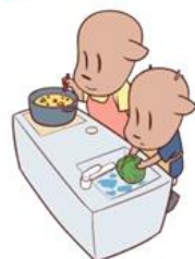
◀調理をするママのしか美としか乃介（しかちゃん）（鹿浜地域学習センター キャラクター）