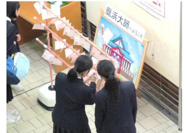
▲鹿浜大師の絵馬に願いを込めて結びます

「高校受験生応援団」に参加した方だけでなくセンターに来館した受験生の皆さんに、1階窓口で絵馬をお渡しします。受験で頑張りたいことなどを書いて絵馬を結びましょう。