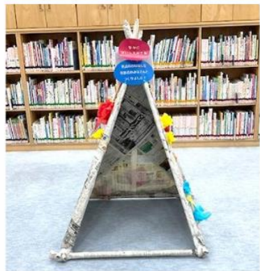
▲中に人が入れる大きさの新聞紙テントを作ります。