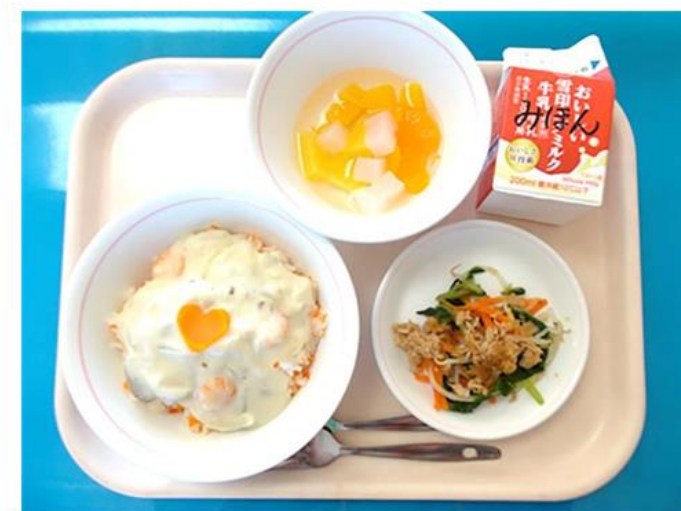
▲足立区の大人気給食メニューのエビクリームライス クリームの上に乗っているのはハート型のラッキーにんじん