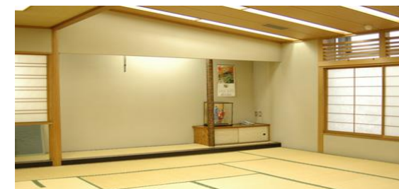
▲室内全景 備品: 座卓10台 ホワイトボード 座布団 設備: 水屋 炉 壁面鏡