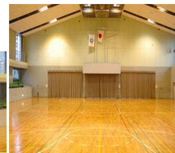
▲館内全景 備品: 机6台 椅子:200脚