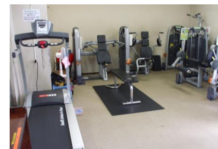
▲ご利用には登録が必要です。 登録日にご予約ください。

設備: エアロバイク(4台)・ステッパー(1台)・ レッグエクステンション・プルダウン・レッグ カール・ショルダープレス・ベクトラルマ シン・ランニングマシン・トレッドミル・レッグ プレス・エリプティカルウォーター