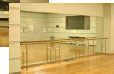
▲ホール全景 収容可能人数 50名 備品: 机:2台 椅子:13脚 黒板 設備: 放送室 スクリーン 洗面台 壁面鏡 CDラジカセ設置 レッスンバーがついています。